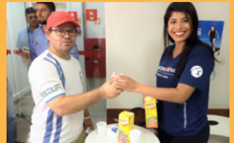
TPAs conversaram sobre câncer de próstata, responderam ao questionário de risco e aproveitaram a mesa de sucos