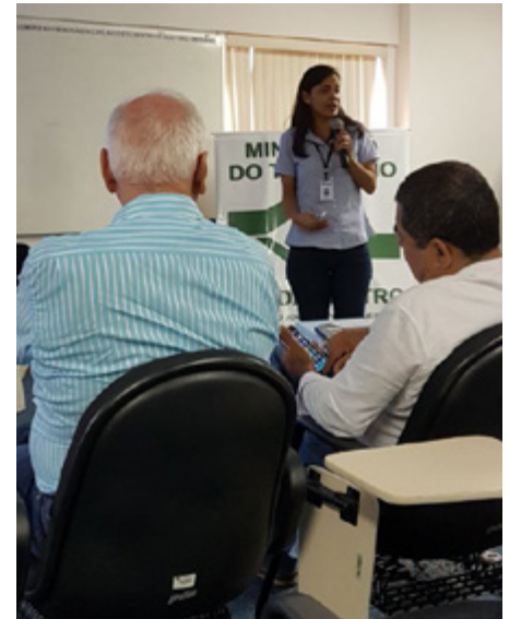
Evento contou com a participação de vários setores do trabalho portuário capixaba

A NR 29 foi publicada no dia 17 de dezembro de 1997 e regulamenta tanto a proteção obrigatória para o