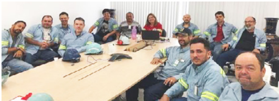
A atuação e as responsabilidades dos conferentes-chefe foram temas das aulas

Conferentes-chefe e segurança formaram várias turmas ao longo do ano. Aulas voltarão em 2018