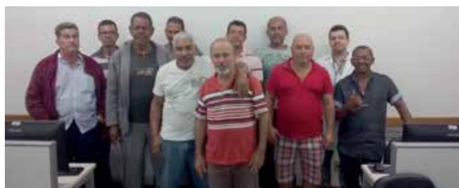
Trabalhadores integrantes da terceira turma