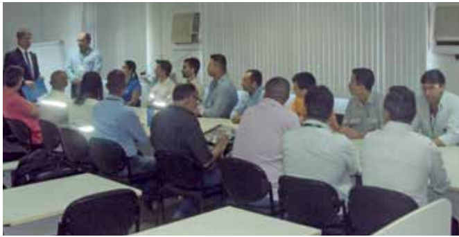
A posse foi realizada no Auditório do Ogm-ES

Após a posse, foi apresentado e aprovado o calendário das reuniões ordinárias e itinerantes para o primeiro ano da Comissão.