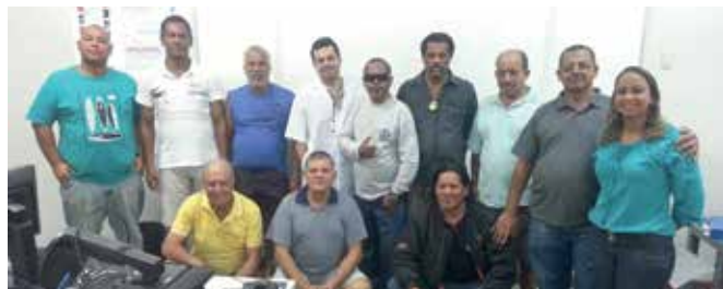
Participantes da primeira turma da capacitação