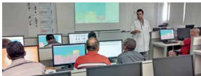
Durante o curso os TPAs aprenderam a usar o sistema de escalação